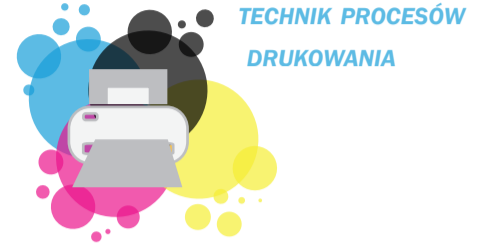
TECHNIK PROCESÓW DRUKOWANIA