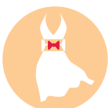
TECHNIK PRZEMYSŁU MODY