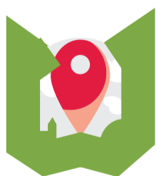
TECHNIK OBSŁUGI TURYSTYCZNEJ